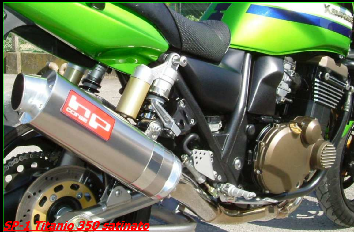
SP-1 Titanio 350 satinato