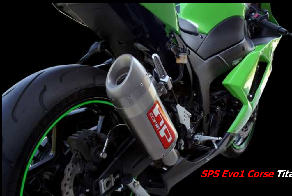
SPS Evo1 Corse Titanio