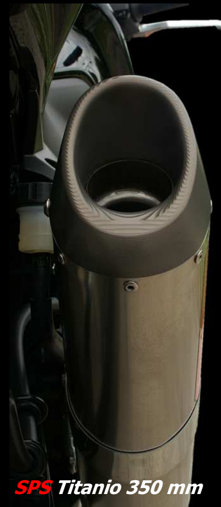
SPS Titanio 350 mm

Raccordo in acciaio inox AISI 304 diametro 60 mm