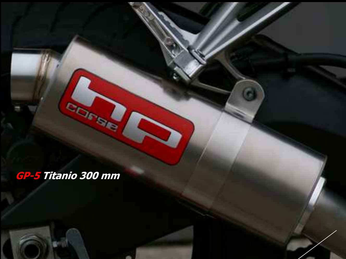
GP-5 Titanio 300 mm